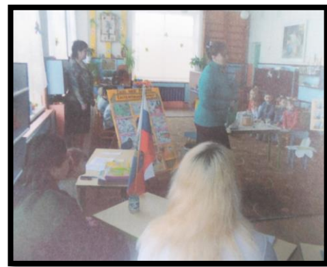
Открытое занятие по патриотическому воспитанию «Моё село – мой дом родной»