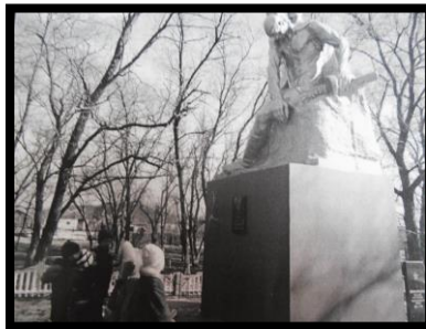
Экскурсии к памятному мемориалу в селе Евстратовка