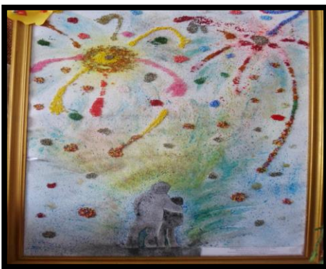
Коллективная работа «Салют победы»