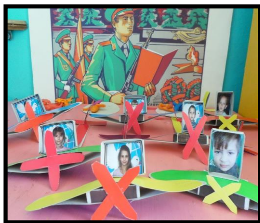
Изготовления подарков для пап к 23 23 февраля