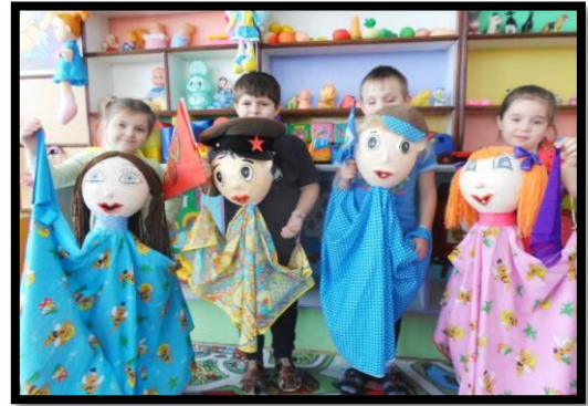
Постановка театра с большими куклами «Мы тоже будем солдатами»