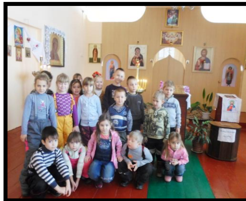
Посещение Евстратовского храма Преображения Господня