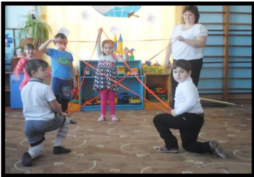
Праздник 23 февраля