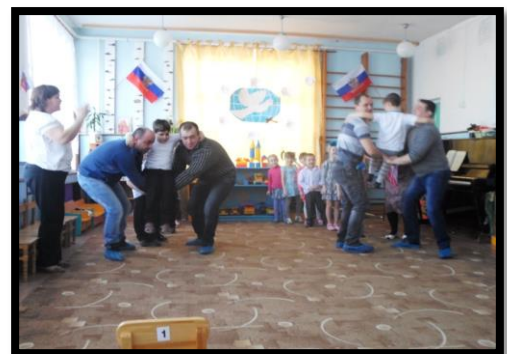
Праздник 23 февраля