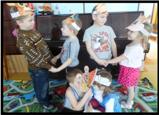
Сказка «Кто под грибочком живёт»