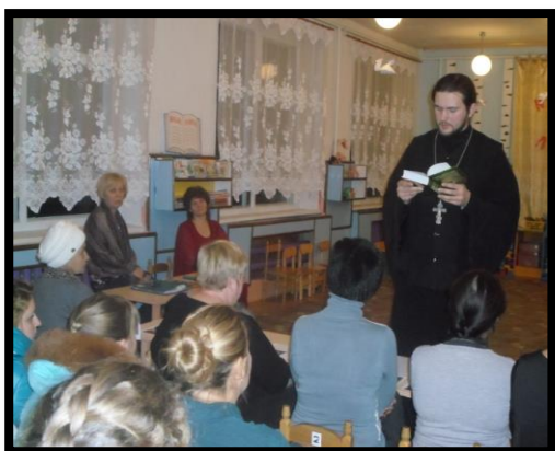
Родительское собрание «Воспитание духовно нравственного качества у детей»