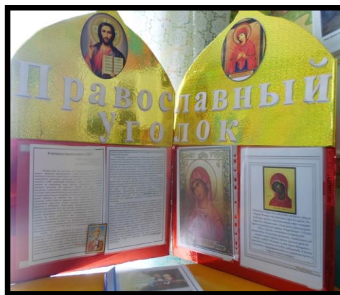
Создание Православного уголка для родителей