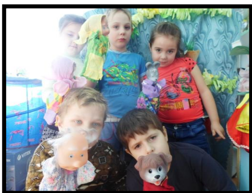
Приобщение любви к Родине через Русские народные сказки Постановка кукольного театра «Репка»