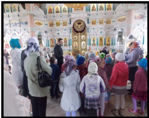
Посещение Ильинского храма города Россоши.