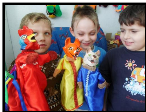
Постановка кукольного театра «Кот, Петух и Лиса»