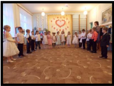
Утренник «Мамин день»