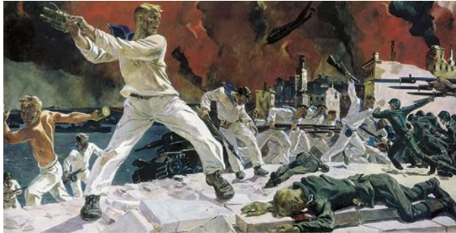
Александр Дейнека. Картина «Оборона Севастополя», 1942 г.

Отлично. С утверждением соцреализма авангардные веяния уступали место реалистической направленности. Символом советской власти стала скульптура В. Мухиной «Рабочий и колхозница», обратите внимание на слайд. Опишите скульптуру.